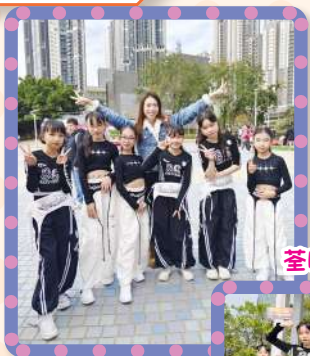
荃晴著手照顧你嘉年華表演