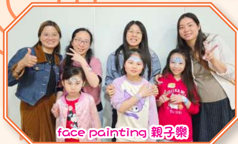
face painting 親子樂