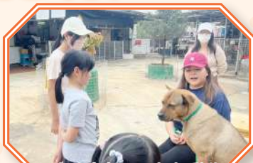
行走大自然 — 親親動物